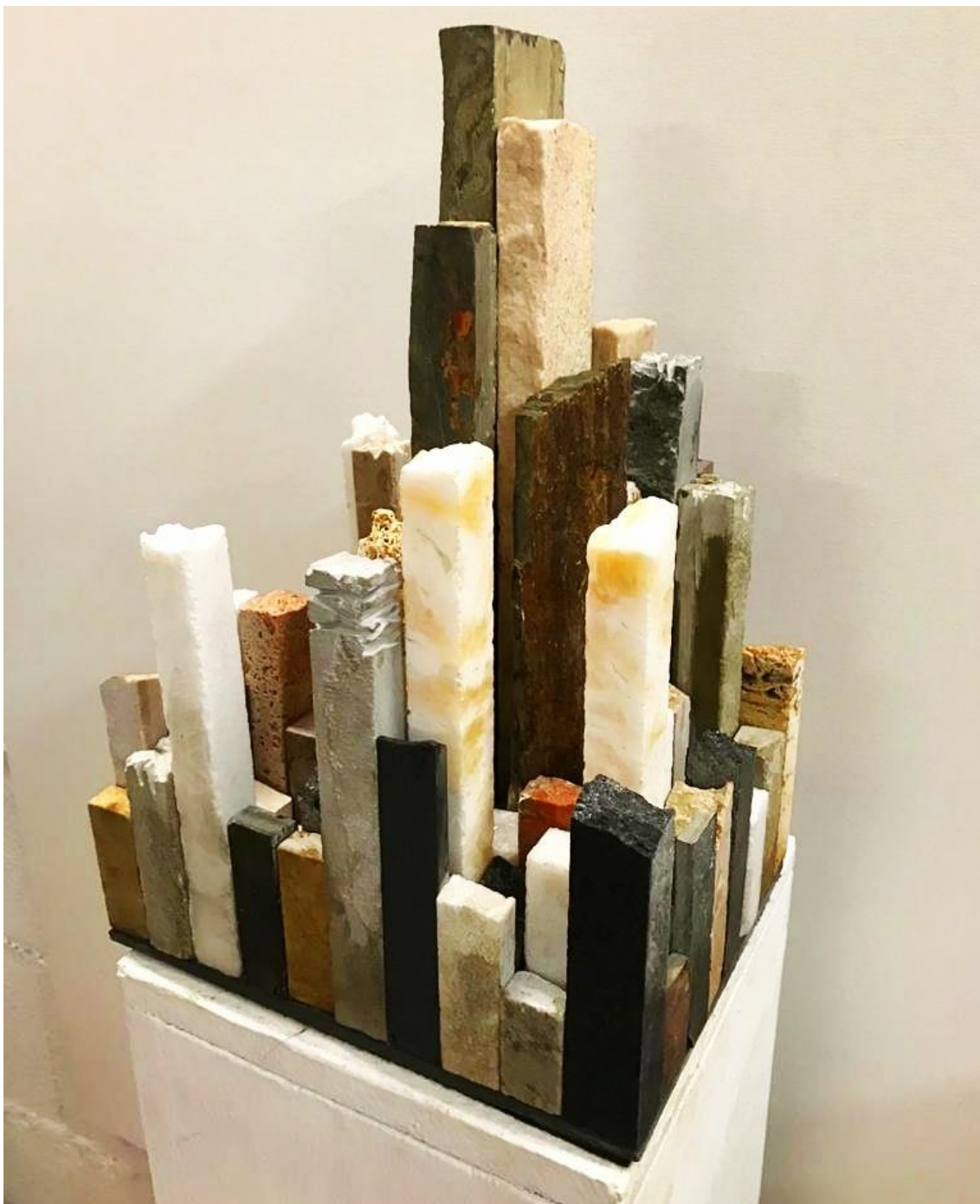
(Pièce du niveau II).

Je vous invite à vous encourager et à vivre cette expérience unique avec moi !!!