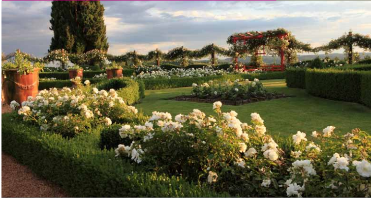
Dans la Roseraie Blanche