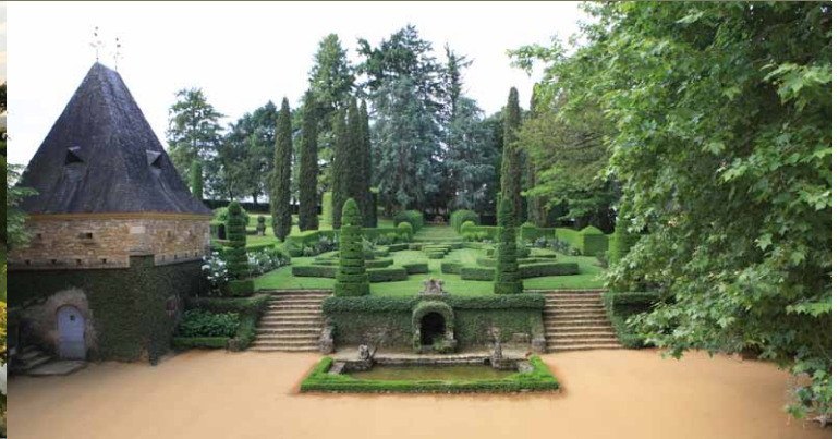
Dans la cour du Manoir

Ces deux lieux exceptionnels peuvent être privatisés à l'occasion d'un cocktail à l'extérieur. Que ce soit face au coucher du soleil dans la Roseraie ou face au Manoir du XVIIe siècle, Ces espaces vous seront exclusifs pour un apéritif à thème, un cocktail dinatoire, le lancement d'un produit ou tout autre événement d'entreprise.